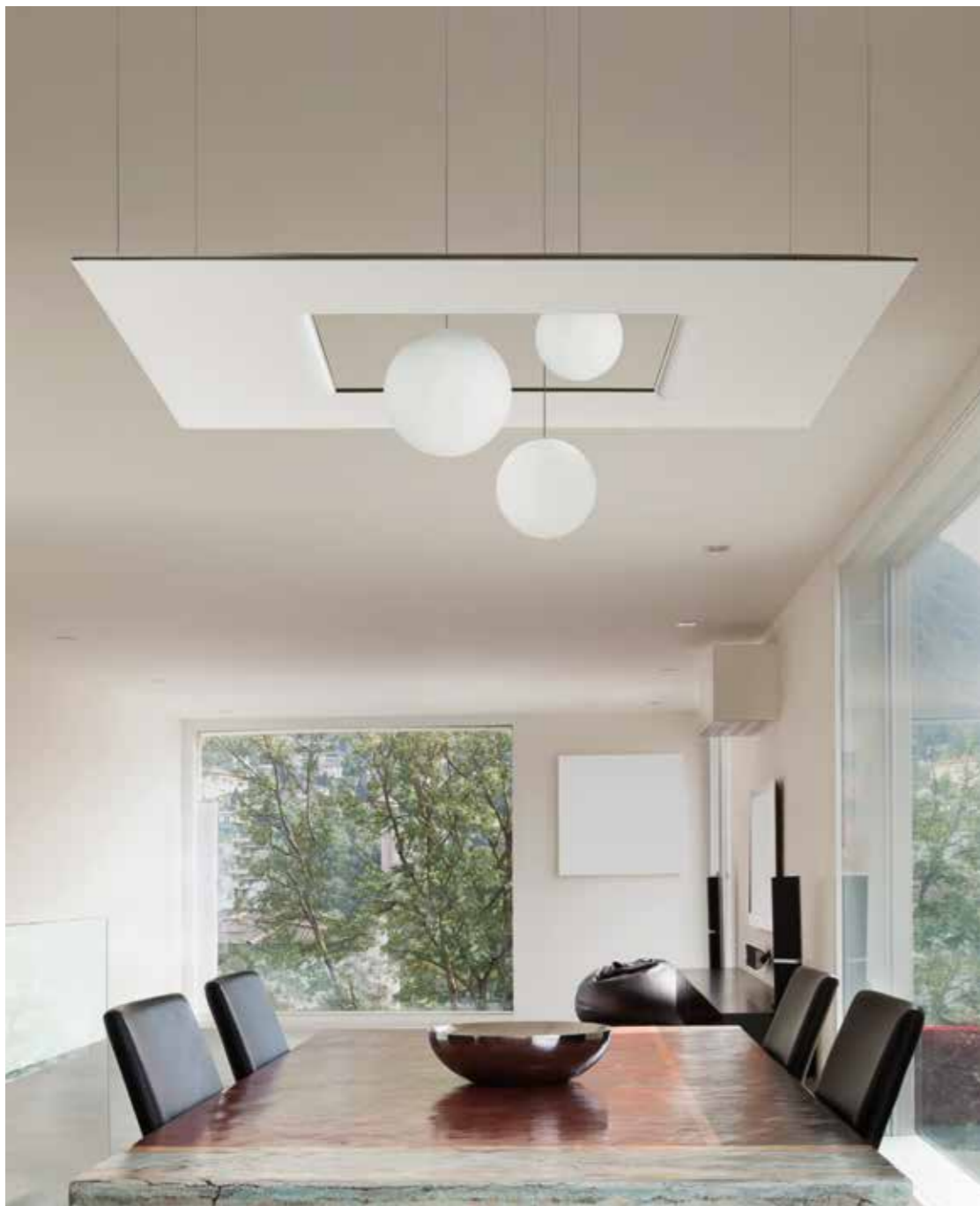
164 - Snowsound Technology