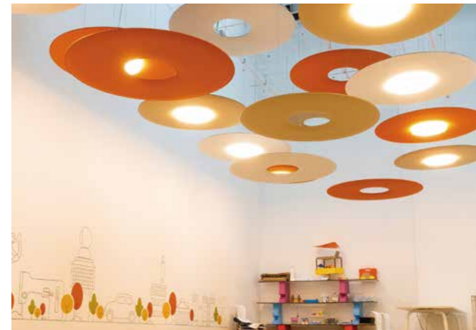
ADI Design Museum, Milano (Italy)