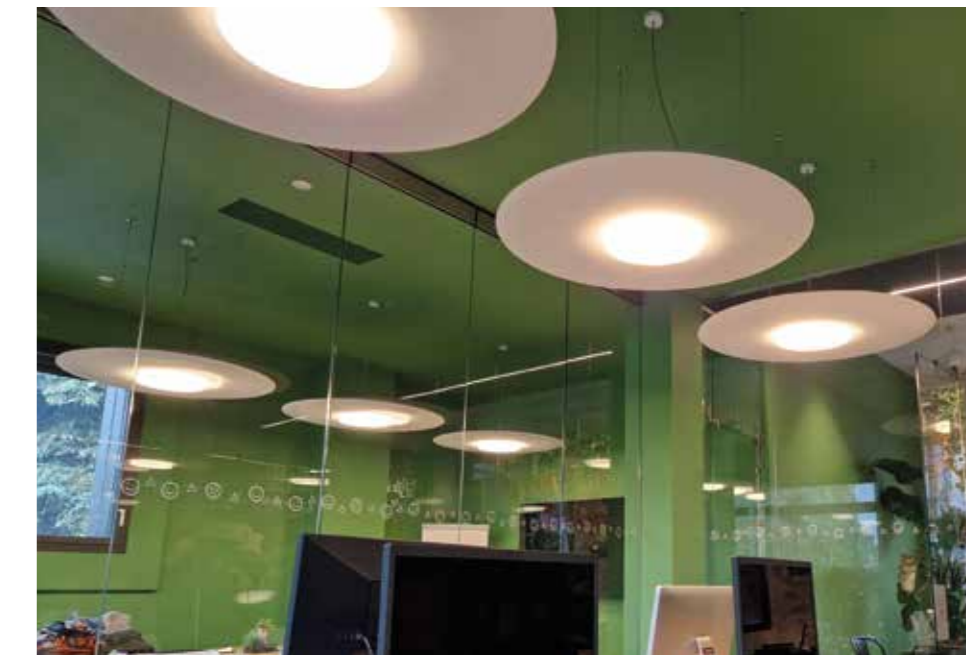
Balsamiq, Bologna (Italy)