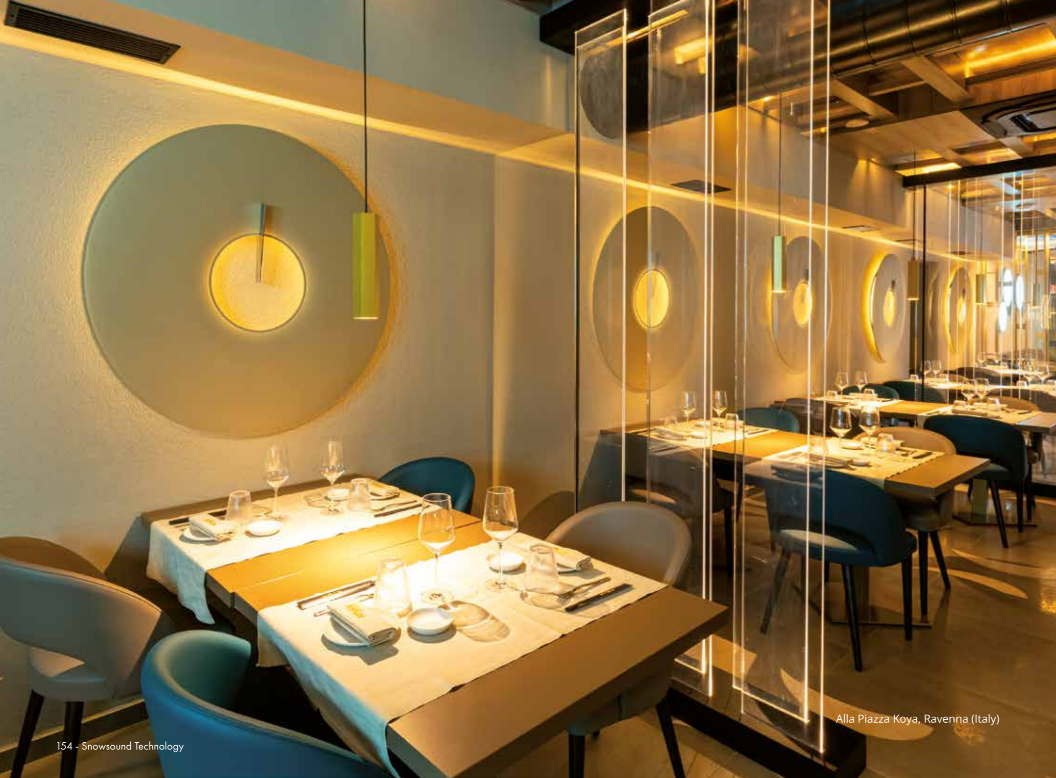
Alla Piazza Koya, Ravenna (Italy)