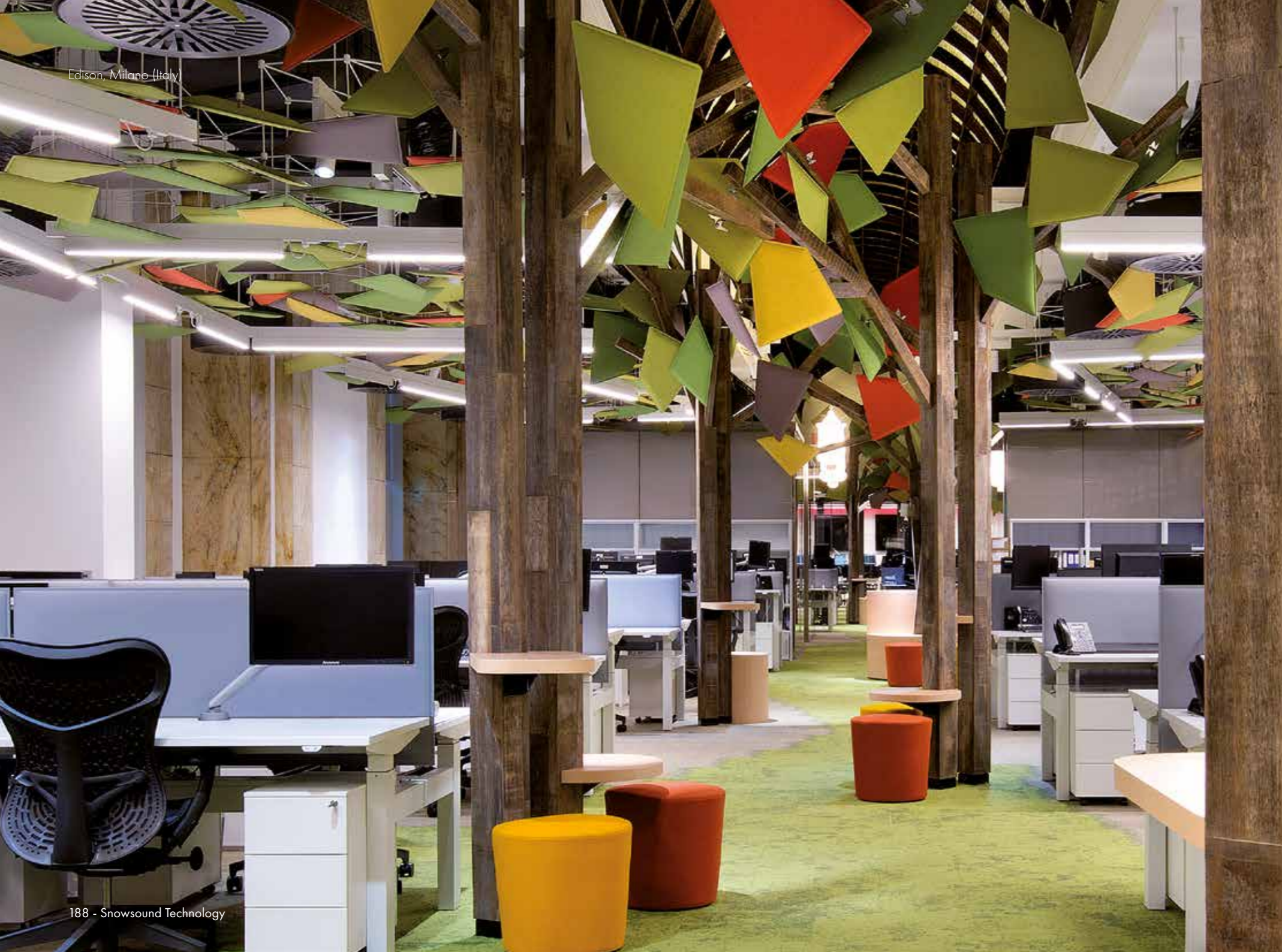
Edison, Milano (Italy)

I _I pannelli Flap sono dotati nella parte posteriore di una piastra in acciaio cromato collegata mediante uno snodo sferico articolato ad un braccio in acciaio cromato che può essere fissato direttamente a parete o a soffitto. Lo snodo permette di ruotare il pannello di 360° e di inclinarlo in tutte le direzioni per personalizzare sia gli aspetti estetici del prodotto che quelli di resa acustica.